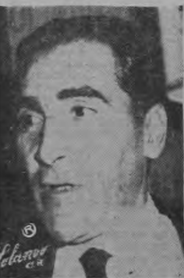
Eduardo Jiménez de Aréchaga ...Tratados que nos salvan...

—Creo que el Derecho Internacional cada vez tiene mayor importancia. Debemos confiar en él. De él dependemos para sobrevivir. El obstáculo mayor para un gran conflicto nuclear es el Derecho Internacional. Aquí incluyo la Carta de las Naciones Unidas y la disposición principal, que impide a los estados el uso de la fuerza, salvo el caso de legítima defensa contra una agresión. No digo que sea el único artículo, pero muy importante, porque ninguno de los estados querrá colocarse frente a la opinión mundial, como responsable de causar un conflicto de esa naturaleza, violando el derecho internacional.