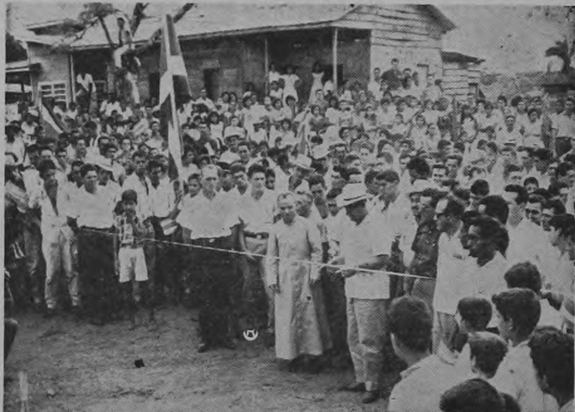
Momento en que el Presidente Orlich corta la cinta simbolizando así la inauguración del cuadrante de la población de Hojanca de Nicoya. En la tarde del domingo se efectuaron desfiles, discursos y despliegue de banderas y entusiasmo que llenó la población con una celebración llena de

Y los aficionados al folklorismo criollo y tradicional, todavía pueden adquirir ejemplares del anterior libro "Espigas y Flores" que contiene la historia legítima del Paso de la Vaca y "El Cochero de don Tomás Guardia". Quedamos pues, en espera de "Desamparados y Otras Yerbas".