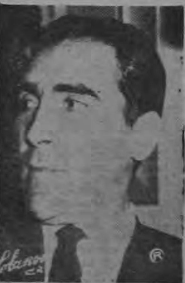
...Avances sobre el exilio...

—Responde don Eduardo: "Comprendo que hay dificultades para dar asilo a contingentes tan numerosos. Ellos justifican más que nunca el derecho de asilo. Soy partidario aquí de la tesis más liberal, impuesta en los tratados firmados en las últimas conferencias americanas. Obligan a que el asilado no puede seguir conspirando desde la embajada. Esto en cuanto al "asilado". En cuanto al "exiliado" creo que es un extranjero igual que los demás, con derechos iguales a los habitantes del territorio. Tales como derecho de expresión, incluso sin configurar una crítica contra el Gobierno; del cual se exiló o al que lo acogió. Todos los derechos individuales. Dónde está el límite. El límite aparece en el código penal. Ningún exiliado puede actuar si configura un delito, por ejemplo, organizar una rebelión contra el Gobierno extranjero, o insultar, hacer apología de delitos, etc."