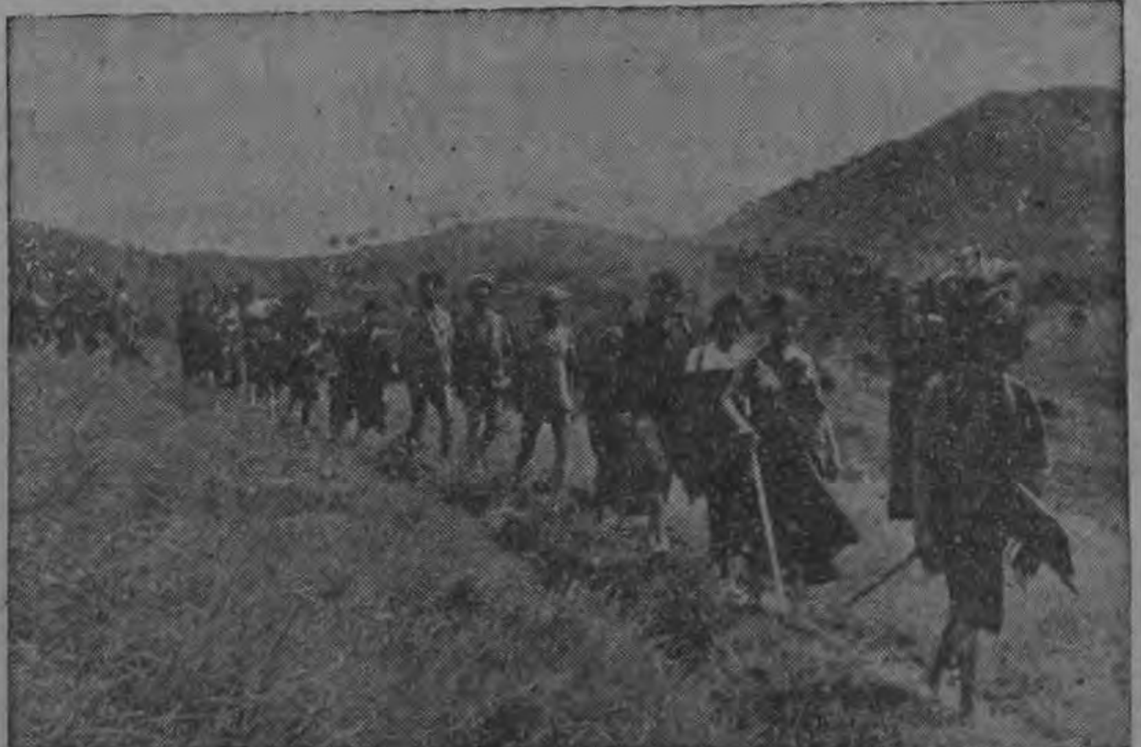
Las tribus primitivas que han habitado durante siglos las montañas del Vietnam meridional, a proximidad del Vietnam septentrional, huyen. Los comunistas han invadido sus tierras y, después de haber experimentado lo que es el paraíso rojo, han preferido quemar sus casas y perderlo todo para ponerse bajo la protección del gobierno democrático del Sur.

Entre los temas que se tratarán con las autoridades uruguayas, según trascendiera en la conferencia de prensa realizada por el Ministro Licurgo Costa en la sede del palacio de Brasil, reviste singular importancia la designación de una comisión mixta uruguayo-brasileña para la concreción de la proyectada erección de un puente en la laguna Merinam en el límite entre ambos países, y la nivelación de la balanza entre ambos países, que en los momentos actuales es notablemente deficitaria para el Uruguay.